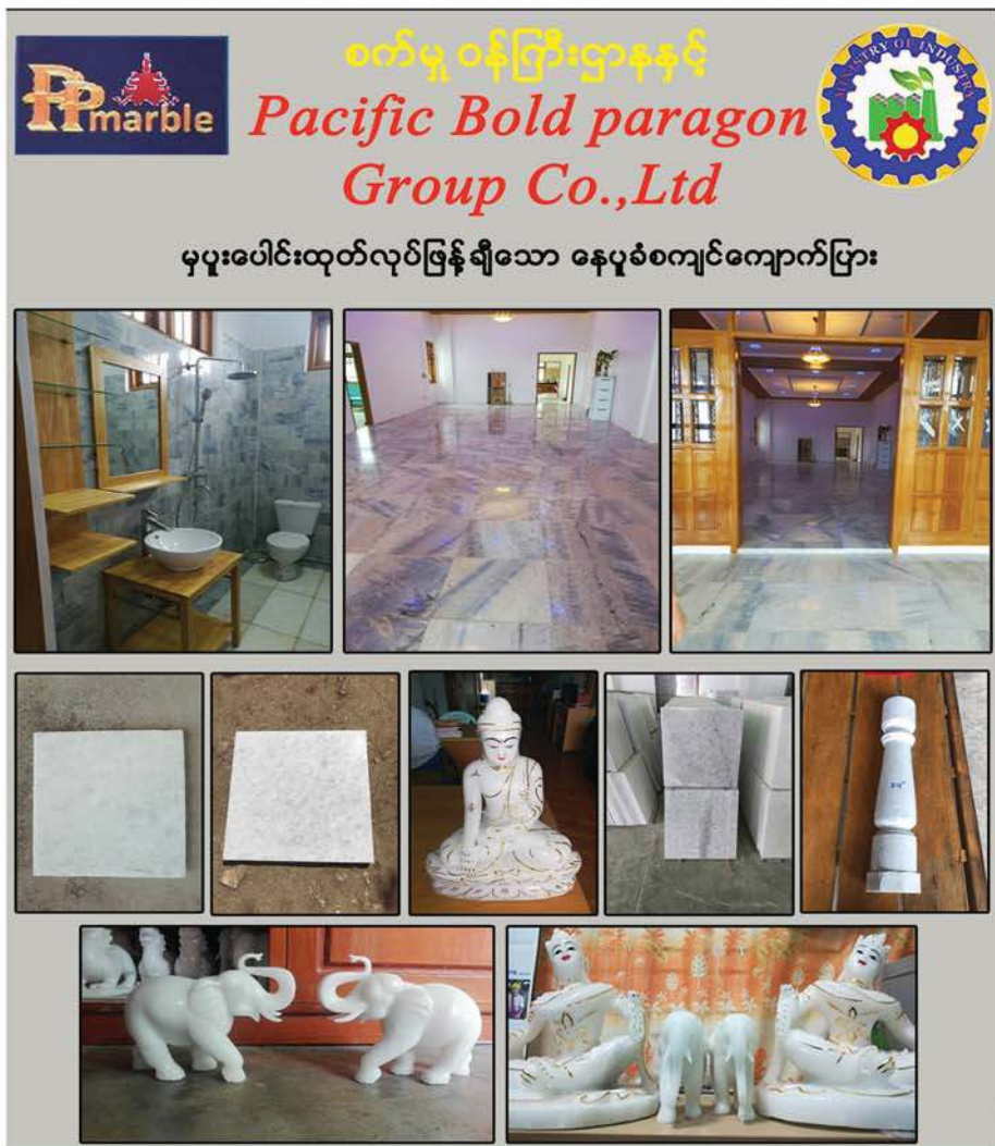
ဆက်သွယ်ရန်

ခေ-၃/၆၆၆၅၇လမ်းသိပ္ပံလမ်းထောင့်၊မန္တလေးမြို့။ 09-5136843, 09-43100532. ၂၇လမ်း၊ ၉၃ x ၈၄လမ်းပြား၊ ဝေတန်းလက်ျား၊ ရေးချို၊ မန္တလေးမြို့။ 02-60305 (Fax) ကျင်ကျောက်ပြားစက်ရုံ၊ မတ္တရာမြို့။ 09-788683359, 09-965136843