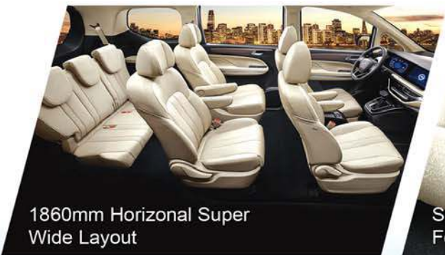
1860mm Horizontal Super Wide Layout