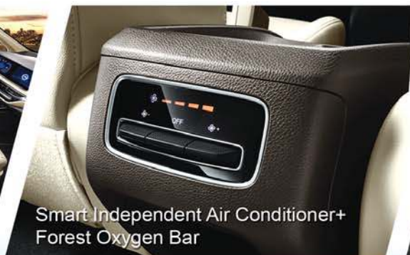
Smart Independent Air Conditioner+ Forest Oxygen Bar