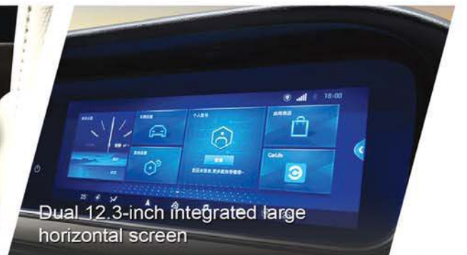
Dual 12.3-inch integrated large horizontal screen