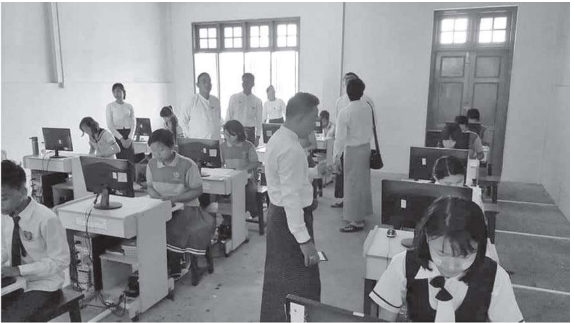
လာရောက်ကြည့်ရှုအားပေးကြသည်။ ကွန်ပျူတာစွမ်းရည်ပြိုင်ပွဲတွင် မာလ်တီမီဒီယာဆရာအဆင့် ၁၀ ဦး၊ အထက်တန်းအဆင့် ၅ ဦး၊ အလယ်တန်းအဆင့် ၄၂ ဦး၊ မူလတန်းအဆင့် ၁၄ ဦး ပါဝင်ယှဉ်ပြိုင်ခဲ့ကြကြောင်းသိရသည်။